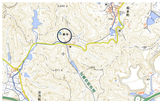
図-3 一乗寺地形図（地理院地図 電子国土 Web）

前面（南面）が開けた法華山南山腹尾根部に複数の平坦面を造成して本堂の大悲閣をはじめとする諸堂を展開し、北方からの小川の流下する東側の谷筋を伽藍内に組み込んだ立地計画、緑や花の美しい環境、境内入口から本堂に至る石階段などは、華嚴経が記す補陀落山の観音菩薩の居所のイメージが投影されていると言えよう。