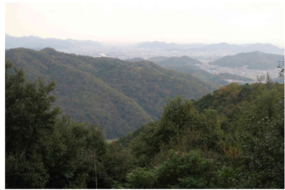
写真-11 境内からの眺望