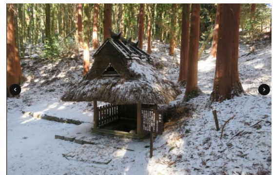
写真-6 滾浄水（おかげの井戸）