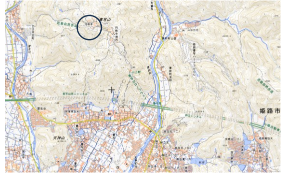
図-4 円教寺地形図（地理院地図 電子国土 Web）

播磨平野北端部から一気に立ち上がる峻険な書写山の山頂付近ならびにその直下の南山腹にあって眺望のきく境内の立地、山麓を夢前川が流れ、境内には山からの湧水が随所に見られる水環境、北側の播磨山地から連なる豊かな樹林―性空上人が観音霊場として開いた円教寺のこうした立地・環境には、『華嚴経』が記す補陀落山の観音菩薩の居所のイメージが色濃く投影されている。