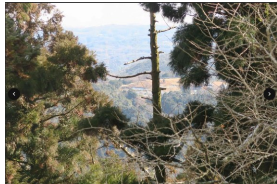
写真-5 大講堂からの眺望