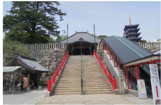
写真-1 現在の中山寺本堂