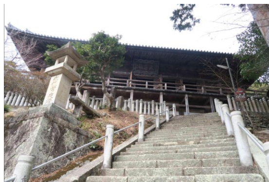
写真-7 本堂 大悲閣