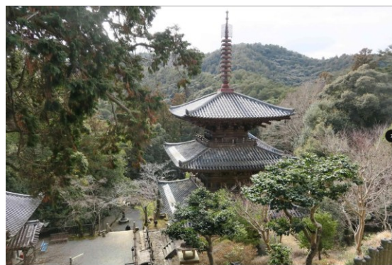
写真-8 本堂からの眺望（手前は境内の三重塔）