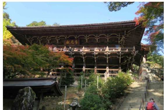
写真-10 摩尼殿