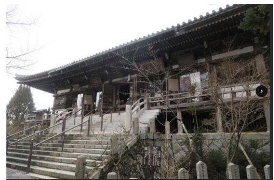
写真-4 播州清水寺大講堂