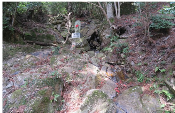
写真-2 奥の院下方の水流