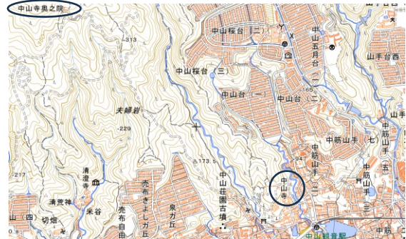
図-1 中山寺地形図（地理院地図 電子国土 Web）

当初の伽藍が展開した現在の奥の院一带は、中山（標高 477.9m）の南山腹部の標高 370m 付近にあたり、現在の伽藍からは比高約 240m、距離にして約 2km の山道を登ったところに位置する。一带には湧水や溪流も見られ（写真-2）、現在は樹木で遮られているものの南方にあたる現在の宝塚市周辺への眺望も卓越したものであったと考えられる。また、中山一带の潜在植生はシイ・カシ等からなる照葉樹林であり、伽藍周辺もこうし色濃い緑に覆われていたものと考えられる。険しい山腹の立地、優れた眺望（写真-3）、水と緑に恵まれた環境といった立地・環境は、観音菩薩の居所として『華嚴経』に描写された補陀落山のイメージと重なる。現在の伽藍も、山麓部の平坦地から 20m ほど高いところに本堂が建てられるなど、補陀落山の斜面イメージを反映したものであることが窺える。