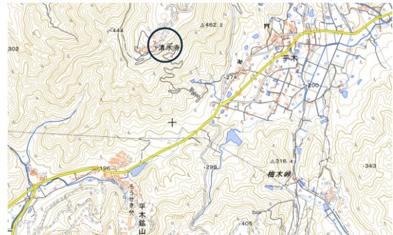
図-2 播州清水寺地形図（地理院地図 電子国土 Web）

前述のように地藏菩薩の霊場とされていたことがあるとはいえ、山頂直下の山腹に造成された伽藍、湧水のある水環境、緑豊かな樹林などは、『華嚴経』に記す観音菩薩の居所たる補陀落山のイメージが投影されていると言えよう。