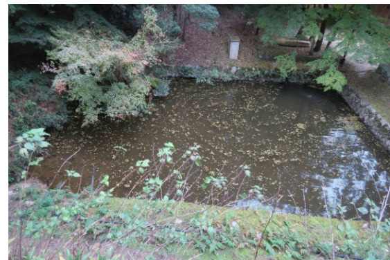
写真-12 摩尼殿脇の放生池